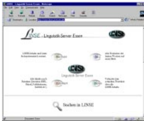
Abb. 3: Homepage des Essener Linguistik-Servers LINSE

Im World Wide Web wird auf mehreren Kanälen und unter Verwendung unterschiedlicher Symbolsysteme kommuniziert. Die im gedruckten Medium dominante Schrift kann nicht nur um Bilder und Graphiken angereichert werden, sondern auch um Ton- und Videodokumente. Webgestaltung heißt, sich bewusst für ein- oder mehrkanalige Informationsvermittlung, für Schrift, Bild, Ton oder Video zu entscheiden, wobei beim momentanen Stand der Übertragungstechnik Schrift und Bild immer noch die zentrale Rolle spielen. Auf Homepages liefern Bilder und Graphiken oft wichtige Hinweise zur Struktur