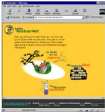
Abb. 8: Lurchi online

den Besucher meist auf professionell gestalteten Homepages, denen anzusehen ist, dass die firmeneigene Site nicht zuletzt auch ein Prestigeobjekt ist, das vor allem prunkvoll und teuer wirken muss. Professionelle Bildschirmdesigner gestalten Homepages gerne als Sequenz von Seiten, als eine Art Begrüßungsritual: Die graphisch aufwändige Einstiegsseite enthält den Willkommensgruß und das Firmenlogo. Erst dann gelangt man auf die Leitseite des Angebots, von der aus Links zu den wichtigsten Rubriken abzweigen – z.B. zu Produktinformationen, Firmenstruktur, Kontaktadressen, Forschungsaktivitäten, gegebenenfalls zum Online-Kundendienst. Es ist allerdings fraglich, ob potenzielle Kunden, die zu Hause über Modem auf das WWW zugreifen, am üppigen Design die reine Freude haben. Unbestritten nützlich sind kommerzielle Sites von