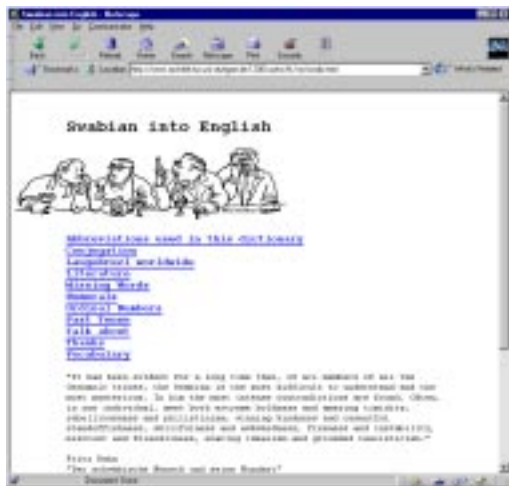
Abb. 6: Homepage zu einem schwäbisch-englischen Wörterbuch

und Intranet. In vielen Institutionen wird das WWW nämlich auch als interner Informationsverteiler genutzt, und natürlich stehen den Besuchern von außen nicht alle internen Informationen zur Verfügung. Umgekehrt haben gerade in großen Institutionen und Behörden nicht alle Mitarbeiter einen eigenen Internet-Zugang, sondern können nur auf die Dokumente zugreifen, die auf der eigenen Site gespeichert sind. Die Homepage muss also im Hinblick auf