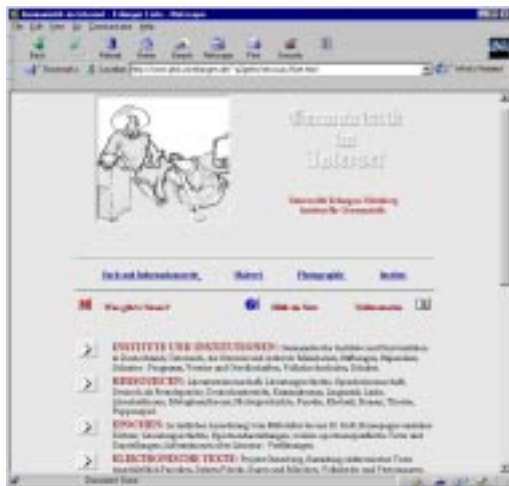
Abb. 5: Erlanger Linksammlung zur Grammatik

jahren des Internet, in denen kostenloser Austausch von Erfahrung und Wissen, Meinungsfreiheit, Selbstorganisation und Selbstverantwortlichkeit aller Nutzer hoch bewertet wurden. Zum Teil werden sehr nützliche Programme zum kostenlosen »Download«, zum Kopieren auf die eigene Festplatte, angeboten. Wertvolle Ressourcen sind auch die so genannten »Linklisten«, das sind thematisch geordnete Sammlungen von Hyperlinks zu Homepages von Webs und Sites, die vom Gastgeber der Homepage gesammelt und als Tips zur Weiterreise bereitgestellt werden. Wertvoll sind solche Sammlungen vor allem, wenn sie entweder auf große Reichhaltigkeit in Bezug auf ein bestimmtes Thema abzielen oder wenn sie versuchen, aus einem riesigen Angebot eine qualitativ begründete Auswahl zu treffen und die angebotenen Links entsprechend zu kommentieren. Linklisten sind besonders nützlich, wenn die automatisch erstellten thematischen Indizes im Internet keine befriedigenden Ergebnisse liefern, weil sich der Suchbereich über Suchwörter nicht präzise eingrenzen lässt. Das Suchwort »dictionary« liefert beispielsweise mehr Reklamematerial zu Printwörterbüchern