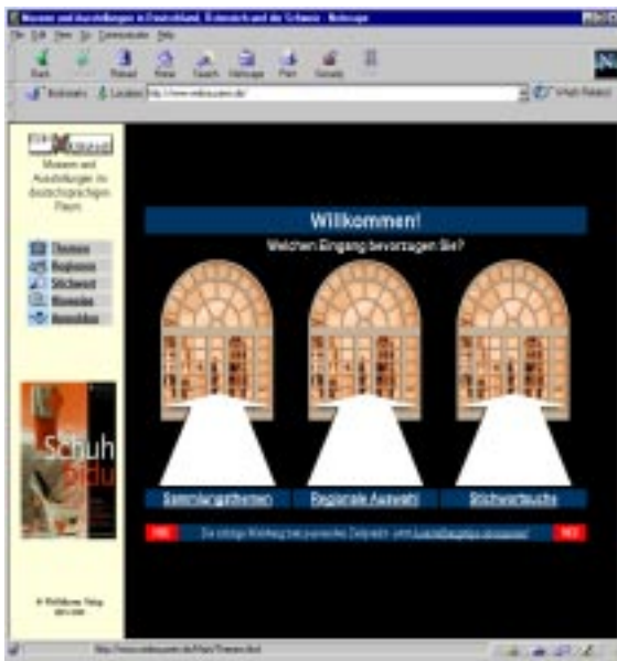
Abb. 1: Homepage zu einem digitalen Museumsführer

wenn überhaupt kann man etwas auf ihr lesen oder nachschlagen. Vor allem aber kann und soll eine Homepage besucht werden, und zwar von möglichst Vielen, möglichst häufig und immer wieder. Dies zeigen typische Formulierungen wie »Willkommen«, »Besuchen Sie uns bald wieder« und Elemente wie Besucherzähler, die Zugriffszahlen automatisch registrieren und als Erfolgsbarometer die Attraktivität des Angebots anzeigen. Viele Homepages enthalten »Gästebücher«, in denen die Besucher aus ihrer Anonymität herausgelockt und zum Hinterlassen von Botschaften, Rückmeldungen u.Ä. veranlasst werden sollen.