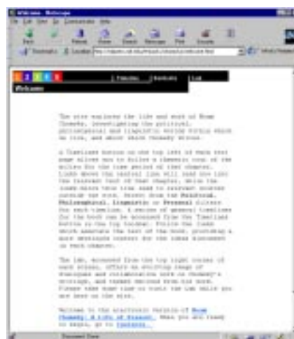
Abb. 2: Homepage einer Biographie zu Noam Chomsky

Eine Homepage fungiert also als Einstieg, Wegweiser und zentraler Orientierungspunkt zu einem Hypertext und trägt wesentlich dazu bei, diesen als eigenständige Einheit zu konstituieren und zu identifizieren. Die Homepage ist die Adresse, mit der in Link-Sammlungen auf Webs und Sites verwiesen wird. Die Funktionen der